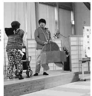
楽しみながら理解できた寸劇

会場となった、いちいの里デイルームでは岩手県物産展や日赤奉仕団によるバザーなどが開催され来場者で賑わいました。式典では、ピアノやまがた音楽クラブボランティア