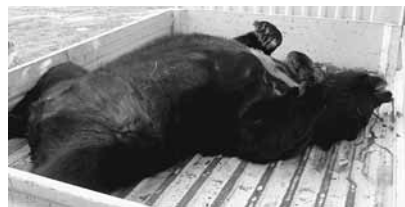
捕殺された150kgを越す成獣

自然豊かな山形村で熊と共生していくためには、今年の各地の取り組みを教訓に、熊を近づけない環境をつくることも大切な点ではないでしょうか。