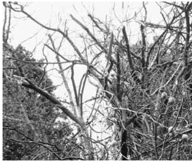
熊に食べ尽くされ、枝も折られた柿