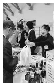
売切れ続出。物産展

12月13日(土)、山形村社会福祉協議会主催・山形村福祉のつどいが開催されました。