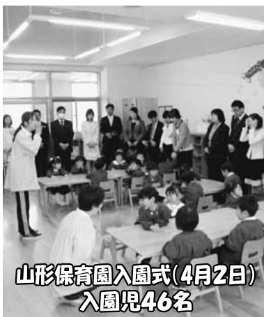
山形保育園入園式(4月2日) 入園児46名