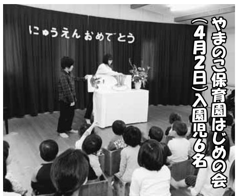
やまのこ保育園はじめの会 (4月2日)入園児46名

遊んで、泣いて、お昼寝して 先生もびっぴいな おにいさん・おねえさんに なっちゃおう！