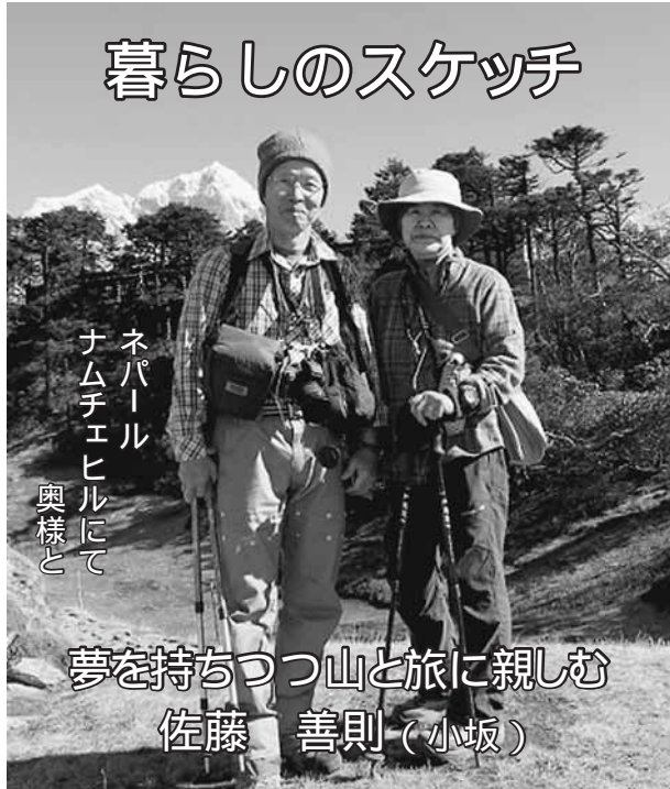
ネパール ナムチェヒルにて 奥様と