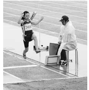
走り幅跳び より遠く

5月の中信地区予選を突破した、女子4x100mリレー、男子80mハードル、女子走り幅跳びの選手たちは、大会に向けて毎朝練習に一生懸命取り組んで来ました。当日は、惜しくも上位大会に進むことはできませんでしたが、練習の成果を精一杯発揮しました。