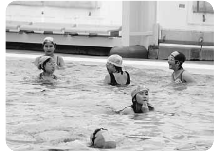
気持ちいいですよ～。