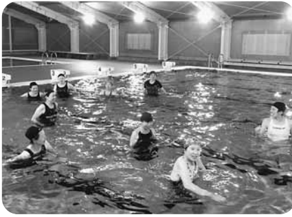
興味のある方は教育委員会まで

6月27日(土)からB&Gプールの営業が始まりました。ひさびさの水の感触に、来場者は思い思いに楽しんでるようです。7月10日(金)からはアクアビクス教室も開講し8名の方が日ごろの運動不足や肩こり解消にと講師の指導を熱心に受けていました。