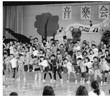
元気いっぱい合唱

6月26日(金)、小学校の音楽会が体育館にて行われました。本番に向けて一か月ほど前から練習を始め、当日は学年