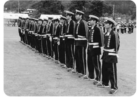
ラッパ隊緊張の整列