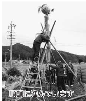
順調に進んでいます