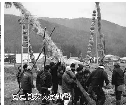
ここは大人の出番