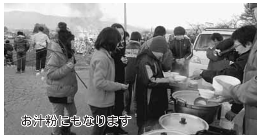
お汁粉にもなります