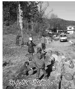
みんなで協力して