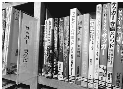
松本山雅はここに！

0 総記 1 宗教・哲学 2 歴史・地理 3 社会科学 4 自然科学 5 工業・暮らし 6 産業 7 芸術 8 言語 9 文学 と大きく分かれ、その中がさらに細分化されます。本の背表紙に3~6ケタの数字が並んだラベルが貼ってあります。これって四捨五入しちゃいけないの？と聞かれたことがあります。が、だめです(笑) 数字にはすべて意味があります。たとえば、サッカーの本は78(スポーツ)の中の783(球技)の中のサッカー(783・47)となります。