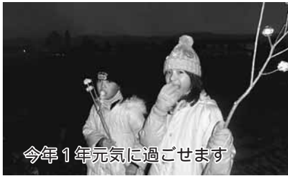
今年1年元気に過ごせます

1月9日(土)、10日(日)に、正月の伝統行事である三九郎が、各地区で行われました。暖冬とは言うものの、時折冷たい風が吹く中、元気な小学生に負けじと、大人たちも頑張る姿が見られました。そんな三九郎の風景を、いくつか紹介します。