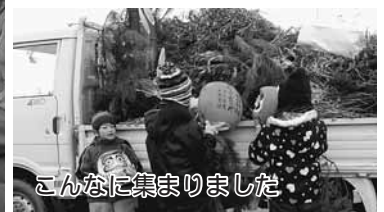
こんなに集まりました