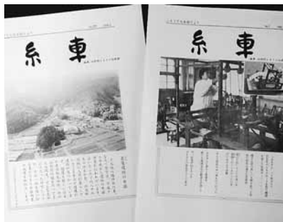
糸車の創刊号(右)と最後となった29号

ふるさと伝承館が開館して3年を迎えた平成2年10月20日に、ふるさと伝承館だより『糸車』の創刊号が発行されました。館内収蔵物の紹介や、遺跡発掘の様子、昔の年中行事の紹介なども行い、平成18年3月の29号まで発行されました。なお、糸車のバックナンバーは、村のホームページから見ることも出来ます。