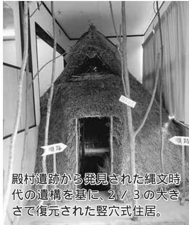
殿村遺跡から発見された縄文時代の遺構を基に、2 / 3の大きさで復元された竪穴式住居。

収蔵物の紹介 数多くの資料が展示されている中でも、『これは』と言うものをここで紹介します。