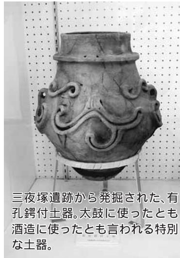
三夜塚遺跡から発掘された、有孔鏝付土器。太鼓に使ったとも酒造に使ったとも言われる特別な土器。