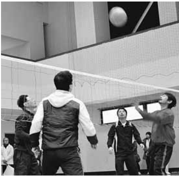
《ソフトバレーボール》