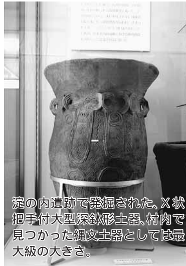
淀の内遺跡で発掘された、X状把手付大型深鉢形土器。村肉で見つかった縄文土器としては最大級の大きさ。

収蔵物の紹介 数多くの資料が展示されている中でも、『これは』と言うものをここで紹介します。