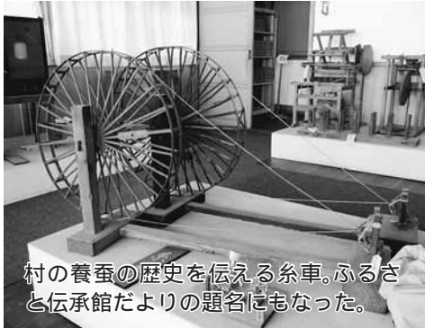
村の養蚕の歴史を伝える糸車。ふるさと伝承館だよりの題名にもなった。