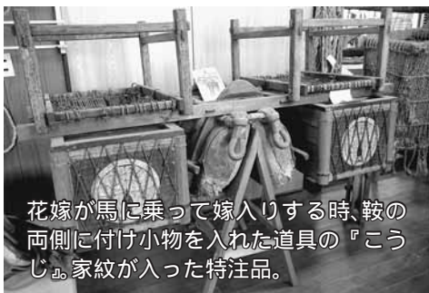
花嫁が馬に乗って嫁入りする時、鞍の両側に付け小物を入れた道具の『こうじ』。家紋が入った特注品。