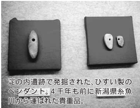
淀の内遺跡で発掘された、ひすい製のペンダント。4千年も前に新潟県糸魚川から運ばれた貴重品。