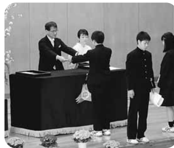
鉢盛中学校 146名 (山形 83名)