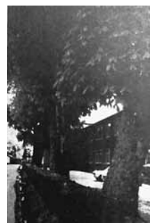
昭和53年当時のとちの木