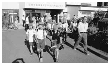
お楽しみの信大生講座 「行ってらっしゃい」「行ってきます」