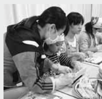
色々な人の協力を得て、料理も無事完成！