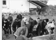
お参りも欠かしません