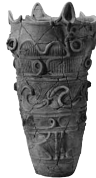
深鉢型土器 (殿村遺跡出土)