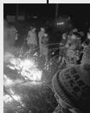
繭玉焼いています