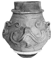
有孔鏝付土器 (下原遺跡出土)

「有孔鏝付土器」は、上部に付けられた孔と、帽子の鏝のような表現が特徴です。用途ははっきりとは解っていませんが、太鼓あるいは酒造りの道具として使われていた物ではないかともいわれています。