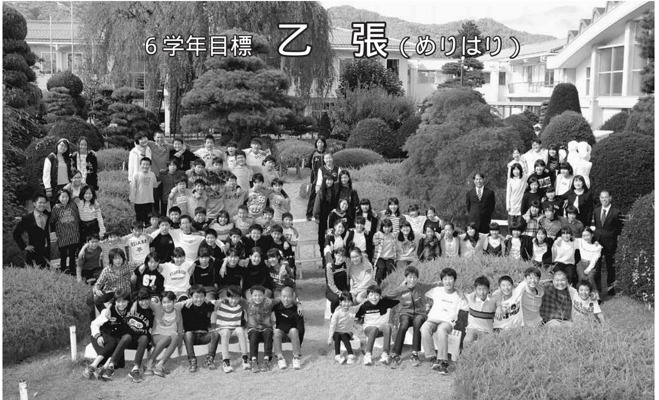
6学年目標 乙 張 (めりはり)