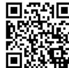
防災メール登録はこちら