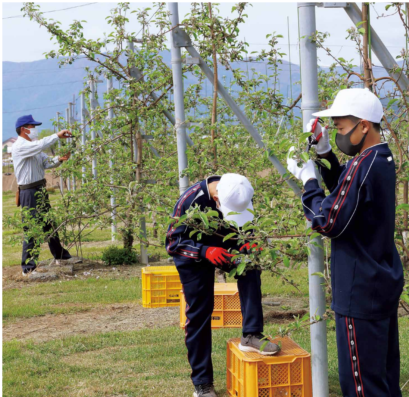
5月14日 鉢盛中学校摘果作業