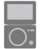
ポータブル DVDプレーヤー