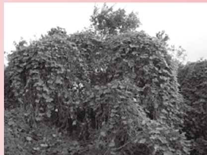
アレチウリ繁茂状態