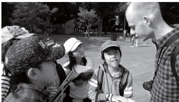
上野公園で外国の方に自作パンフレットを使って山形村についてインタビューする山形小6年生

6年生は、「山形村ふるさとプロジェクト」と題して、総合的な学習の時間にふるさと学習を行なっています。まず、山形村の良いところを考えることから始めて、自らが「山形村の宝調査隊」となり、聞き取り調査や現地調査を行ないました。そこで調べた「村の宝」の内容をポスターにまとめ、保護者やボランティアの方に発表しました。「長く住んでいるのに知らなかった村の宝を知ることができた。」