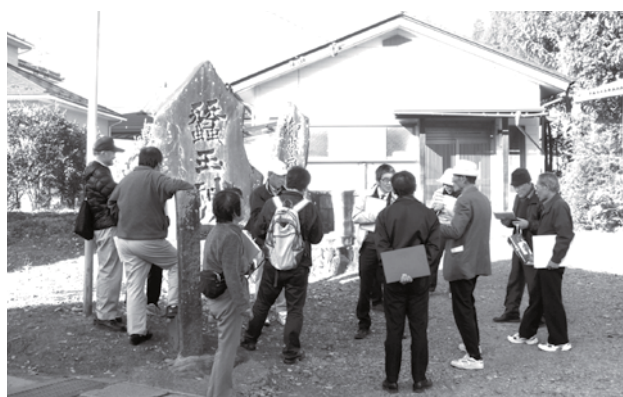
現地確認会の様子

現在、生涯学習の一環として組織された「ふるさとづくり推進協議会」において、6回のワークショップに加えて、現地確認会を行ない、衣食住、歴史、産業、自然環境、健康・防災、人物・文化財など、多様な分野について、様々な角度から、子どもたちに伝えたい山形村の地域資源を拾い出し、その教材化を進めています。今年度中には、その資料等を活用して、山形小学校の児童によるAR ※ データを作成し、活用していくことにしています。