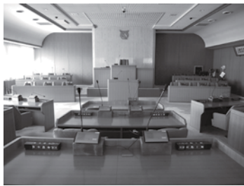
山形村議会運営委員会