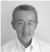
下大池・下大池下村 旗町 清