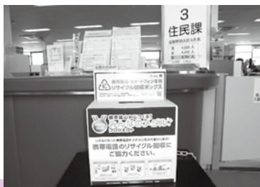
住民課に設置した回収ボックス

このプロジェクトでは、使用済み小型家電のリサイクルへの協力を促し、回収した小型家電から抽出される金属を用いて、東京オリンピック2020大会の入賞メダルを製作します。