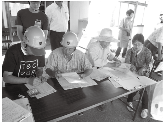
▲安否確認訓練の様子