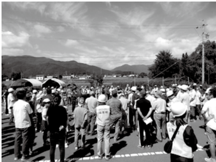
◀2次避難場所に避難