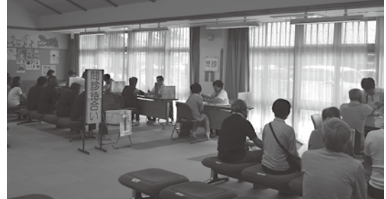
▲健康スクリーニング会場の様子