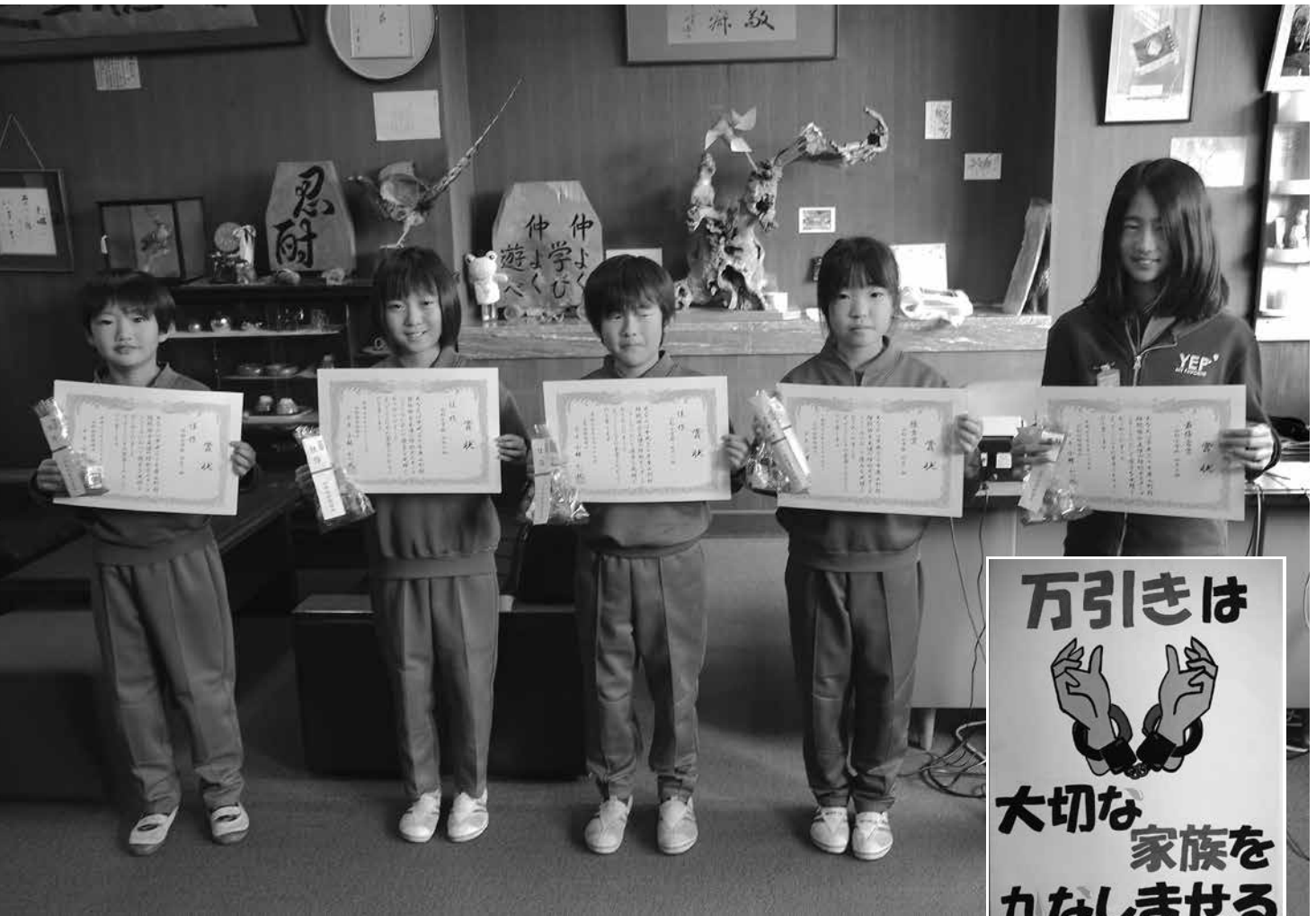
(10月29日山形小学校表彰式にて)