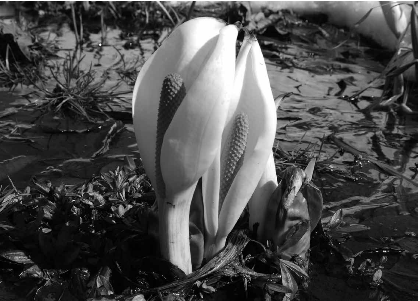
(小坂 鷹の窪自然公園)

暖かい日が続き、春の訪れを感じるようになりました。雪解けの冷たい水の中では、水芭蕉が白く可憐な花を咲かせています。水芭蕉の花言葉は「美しい思い出」だそうです。春は、出会いと別れの季節。喜び、悲しみ、寂しさや期待、様々な感情が伴う美しい思い出が積み重ねられていきますね。