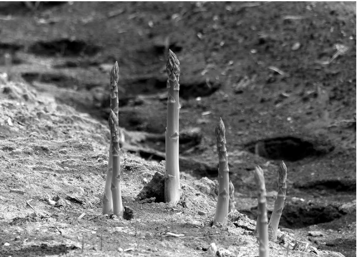
(5月4日 大池原の畑にて)

春の味覚であるアスパラガスの収穫が始まりました。日本では桜前線が春を告げますが、ヨーロッパではホワイトアスパラガス前線が春を告げるそうです。観光協会では収穫体験を6月10日まで行なっています。採れたてならではの風味と食感を味わってみませんか？