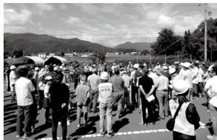
平成29年の2次避難場所に避難した様子

じめ申し合わせた場所に集合し、隣近所の安否確認を行ない、1次避難所に避難（集合）してください。その時点で連絡班全世帯の安否確認を行ない、確認できた方とできなかった方の集計をします。その際、高齢者世帯や障がい者など、災害時に特に支援が必要であることを事前に登録している方の所在確認を行ないます。 続いて各区に開設された2次避難所に移動します。ここで各連絡班の安否確認や要支援者の状況が区長に報告され、更に村の災害対策本部に伝達されます。