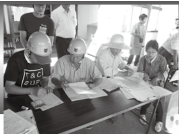
平成29年の安否確認訓練の様子

今年も、県内では栄村、全国では群馬県や大阪府で大きな地震が発生しました。本村にも甚大な被害をもたらすであろう糸魚川―静岡構造線（中部）地震や近年、切迫性の高まりが心配されている南海トラフ地震など、私たちは常日頃から多くの災害に備えなければなりません。村では、9月2日(日)に地震総合防災訓練を実施します。