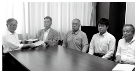
協定を結んだ村長と「山形村空き家等利活用促進連絡会」加盟業者の代表者

村に使用していない住宅をお持ちの方は、バンクへの登録をご検討ください。詳細は、お問い合わせください。