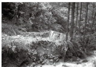
パワーシヨベルが横転

幸いにも、この2つの台風による人的被害は、台風10号の際の軽傷1名のみ。これは、多くの村民の皆さま、消防団が助け合い、大変な苦勞をしながら災害に対処したからではないでしょうか。こういった過去の災害を振り返り、山形村でもこういったことがあったのだと子どもや孫に話をし、災害について家族で考える機会を持つてみてはいかがでしょうか。