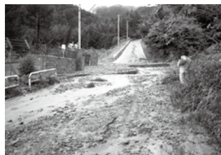
土砂が流入したスカイランド きよみずへ通じる道路