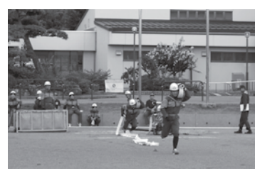
小型ポンプ操法訓練