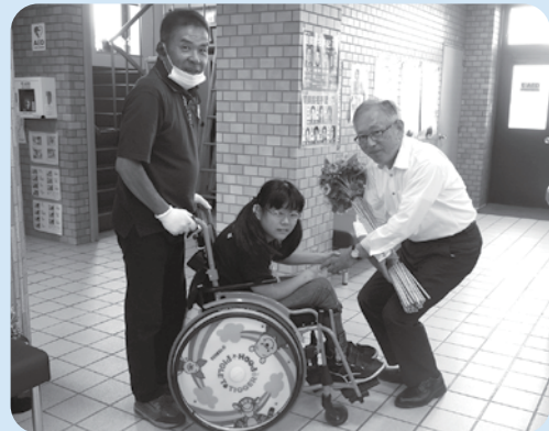
NPO法人あゆみが運営する障害者支援施設「ひよこはうす」から出荷用に栽培しているひまわりをいただき、役場に飾りました。ありがとうございました。