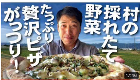
【これ以上の贅沢ある？】採れたて野菜たっぷり！村の産直にあるピザとソフトの…