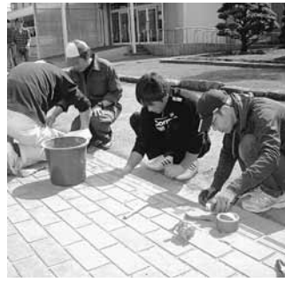
昇降口タイル貼りの様子

5月24日(土)、6年生の保護者と職員を中心に、約100名が参加して、小学校PTA作業が行われました。