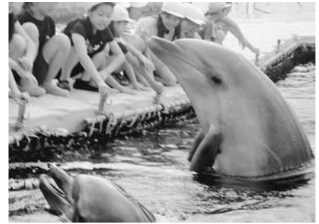
イルカと触れ合う

8月21日(木)・22日(金)の2日間、山形小学校5年生が海の学習に行ってきました。7月に予定されていた愛知県への学習旅行が台風8号の影響で延期となり、実施日を改めて今回の学習となりました。 1日目は三菱自動車岡崎工場の見学のと、日間賀島へ渡り海の学習をしました。 2日目は島の散歩、買い物をしたのち島を離れ、名古屋港水族館の見学に行きました。盛りだくさんの内容で子どもたちも良い思い出となったことでしょう。