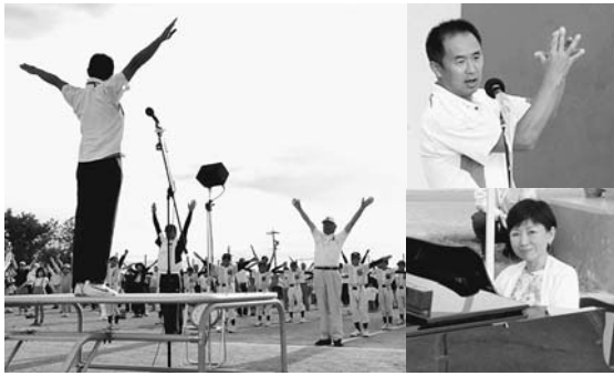
明るく軽快なトークと体操。そしてピアノが奏でる爽やかで心地いい時間が、8月の山形村に流れました。