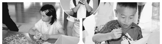
くつした輪っこ編み