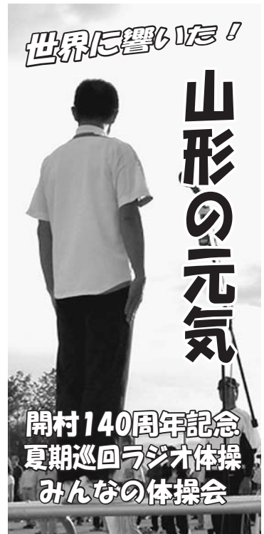
開村140周年記念 夏期巡回ラジオ体操 みんなの体操会

らびに世界各国に発信することができました。今年の夏は天候不順続きで当日の天候も心配されましたが、参加者のやる気に押しされた雨雲たちは、この日ばかりは遠慮したようです。夏らしい朝日につつまれながら行われた体操会は、楽しい夏の思い出となりました。