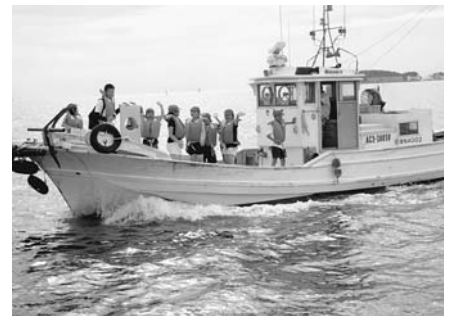
漁船クルージング