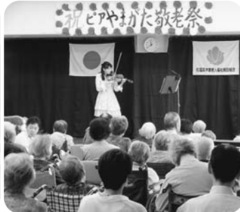
ピアやまがた敬老祭