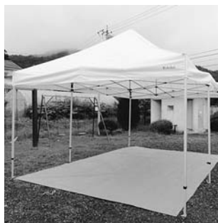
ワンタッチテント

山形村役場、農業者トレーニングセンター、保健福祉センター、「いちいの里」、子育て支援センター「すくすく」、山形保育園、ふれあいの館、ミラ・フード館、ふれあいドーム、山形小学校、スカイランドきよみず、上大池コミュニティセンター、中大池語りべの館、小坂公民館、下大池公民館、上竹田公民館、下竹田公民館、いちいの里「すばる」、コミュニティハウス「建部の里」