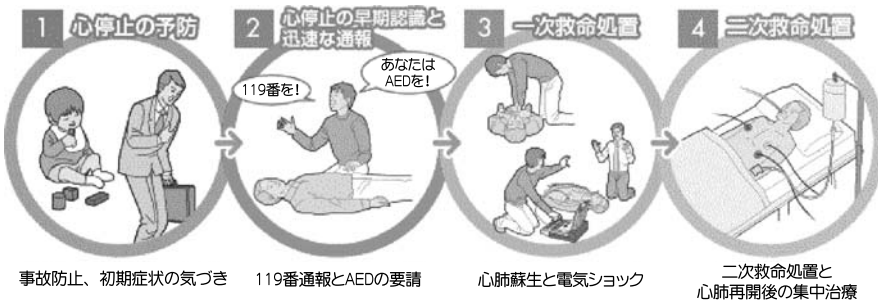
事故防止、初期症状の気づき 119番通報とAEDの要請 心肺蘇生と電気ショック 二次救命処置と心肺再開後の集中治療

傷病者の命を救い、社会復帰に導くために必要となる一連の行いを『救命の連鎖』といいますが、『救命の連鎖』は、 ① 心停止の予防 ② 心停止の早期認識と通報 ③ 一次救命処置 ④ 二次救命処置 で成り立っています。 ※上の図参照