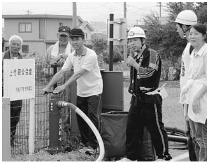
消火栓の取り扱い訓練