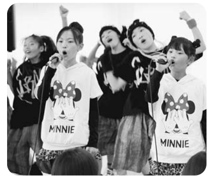
Rs&キッズ・ダンス・ボックス

9月7日(日)、スカイランドきよみずにおいて「清水高原音楽フェスティバル2014」が開催されました。屋内運動場内の特設ステージで、村内外の5組が出演し歌や和太鼓などの演奏を披露しました。Rs(アース)&キッズ・ダンス・ボックスは、歌とダンスのコラボレーションが素晴らしく、観衆を魅了しました。また、会場内ではフリーマーケットや農産物の販売も行われ、スカイランドきよみずでも縁日コーナーや豚汁の振る舞いもあり、高原のすがすがしい空気の中、来場者は1日を満喫していました。