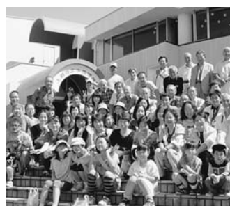
上越水族館で全員集合