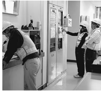
全村放送とサイレンの吹鳴