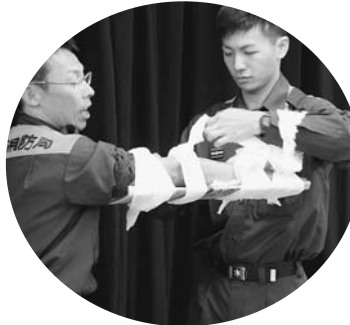
骨折したところの前後2カ所の関節をしっかり固定する