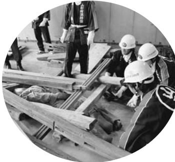
ジャッキ等を使いがれきの下になった方の救助訓練