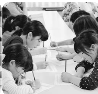
班の目標を決める子どもたち