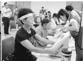
ストレスチェック