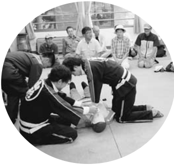
病院勤務団員による人工呼吸と心臓マッサージ

9月6日(日)、毎年開催されている「山形村地震総合防災訓練」が行われました。避難訓練後は各地区でそれぞれ講習会等を企画し、充実した訓練となりました。また、午後には山形村消防団の防災訓練も行われ、松本広域消防局の職員指導の下、真剣に訓練に取り組んでいました。