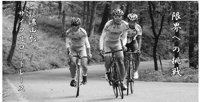
信濃山形 サイクルロードレース