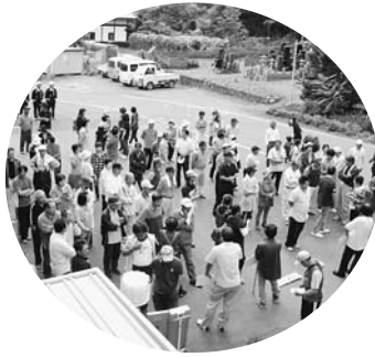
ぞくぞくと避難場所へ集まってきました