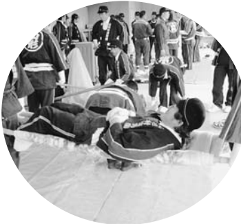
毛布を使った簡易担架