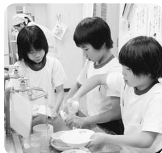
あと片付けをする子どもたち

テレビやゲーム機のない異年齢との共同生活の中で、「思いやること」「助け合うこと」「がまんすること」を学び、生きる力と社会性を養う場として開催されている「リーダー養成通学学舎」が、8月30日(日)から9月2日(水)までの3泊4日で開催されました。今年度は、信州大学の学生も初めて参加し、日頃学んでいる分野を、子どもたちにわかりやすく、楽しく学んでもらおうと3つのブースで特別講座を開きました。子どもたちは、①偏光板で万華鏡②簡易な分光器を作ろう③煮干の解剖標本の3つに別れ、大学生からの説明を聞きながら、目を輝かせ熱心に取り組みました。学生たちは、寝食をともにしながら、生活全般の見守りや学習の支援、班ごとに立てた目標や日々の振り返りにも参加しました。理科の教員を指導する学生たちからは、「普段子どもと接する機会がなく、子ども一人ひとりで理解度も違い、とてもいい経験になった」と話していました。また、子どもたちも親しみやすい学生との生活を楽しんでいました。