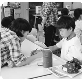
学習支援する学生