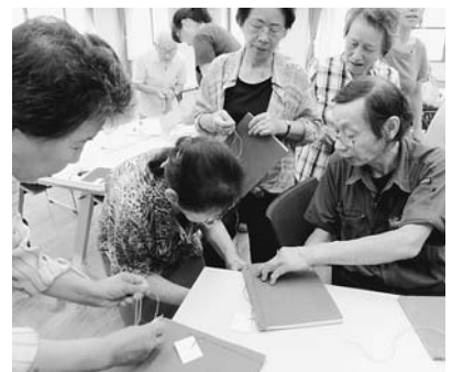
「次はどこに糸を通すの？」 「ここを通して、きゅっと締める」