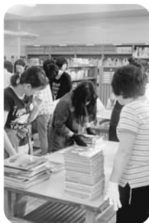
図書館での蔵書整理

今回の作業は、5年生の保護者を中心に、運動会のテント設営、生垣の剪定、新しくなった図書館の蔵書整理等を行いました。小学生のみならず、きれいになった図書館でたくさん本を読みましよう。