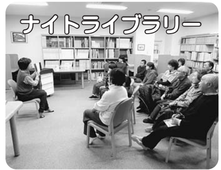
ナイトライブラリー

11月13日(金)・19日(木)・25日(水)、ナイトライブラリーが開催されました。第二夜は「たいせつなもの」をテーマに、語りと絵本の読み聞かせが行われ、より物語の世界に入り込んでもらえればと、電気を消し、ローソクに火を灯して行われました。参加者はお話の会メンバーによるやわらかな語りの世界にひきこまれていました。