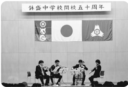
鉢盛中学校開校五十周年

11月13日(金)・19日(木)・25日(水)、ナイトライブラリーが開催されました。第二夜は「たいせつなもの」をテーマに、語りと絵本の読み聞かせが行われ、より物語の世界に入り込んでもらえればと、電気を消し、ローソクに火を灯して行われました。参加者はお話の会メンバーによるやわらかな語りの世界にひきこまれていました。