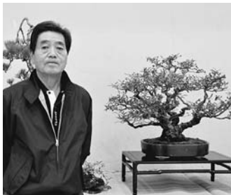
受賞のタチバナモドキと

山形村総合文化祭でも盆栽と山野草の会のコーナーに出展され、受賞時より多少は実が落ちてしまったそうですが見事な盆栽でした。若い頃は山野草に夢中だ