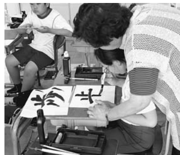
筆使いを意識して 書道