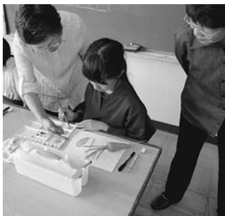
上手に書けています♡ 絵手紙