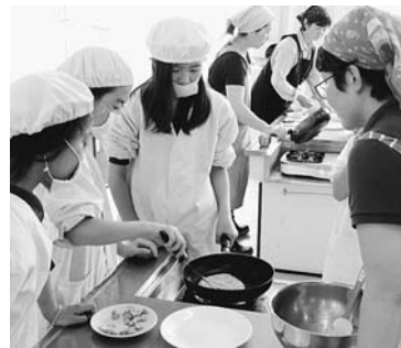
美味しく焼けたかな？ 郷土料理

山形小学校の『わくわくクラブ』の活動が今年も始まっています。4年生から6年生の児童が15あるクラブに分かれて、学校支援地域本部のクラブ活動支援部のボランティアの方々から指導を受けながら様々な活動を行っています。2回目のクラブ活動となった6月30日(休)、郷土料理クラブではJA松本ハイランド女性部山形支部の方の指導を受けながら、長芋をメイン食材とした「ながいものチーズガレット」作りなどに取り組んでいました。各グループで皆が協力して作った料理を、美味しそうに食べている姿がありました。わくわくクラブの活動は校内だけでなく、なろう原公園で活動するマレットゴルフクラブや、村内を巡る「昔の遊び歴史散策」クラブなどもあります。わくわくクラブは、9月までの全5回の活動となります。ボランティアの皆さま、ご協力ありがとうございます。