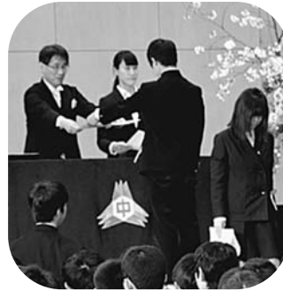
3月15日(水) 鉢盛中学校