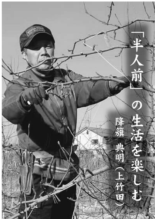
「半人前」の生活を楽しむ

これで自分がこの村に戻ってきた「きりきりした生活からおさらばすること」が少しは達成できそうだと感じて近頃しみじみ感じています。「生活」というのは、仕事に費やす時間を減らすことではなく、過ごす時間の質を高めることによってこそ、変わるのかな」と。