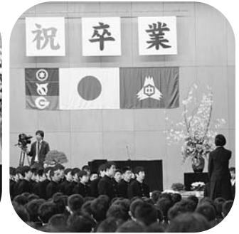
3月16日(木) 山形小学校