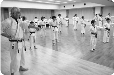
鋭い拳を突き出す