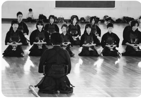
目を閉じて精神統一