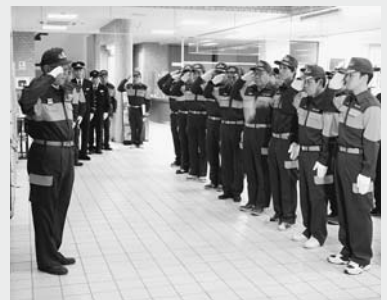
年末特別警戒激励式