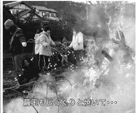
繭玉もじっくりと焼いて...