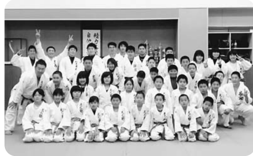
初代からのOB・OGも集結