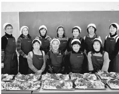
私たちが作りました

昭和60年の発足以来、長年にわたり食育や食生活に関する教室、研修会を開催し、乳幼児から成人まで村の幅広い世代の食生活改善に多大な貢献をされました。