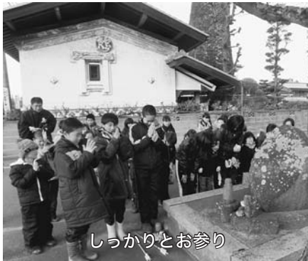
しっかりとお参り