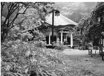
ヒメシャガの花と本堂

5月下旬の清水寺はさまざまな花に彩られますが、天候不順のせいも、今年は開花が遅く花持ちもいまひとつ。それでも、今年も多くの花が激しい雨に耐え、参拝者を迎えてくれています。日々の慌ただしさに癒された心を、草花と静寂で癒してみませんか?