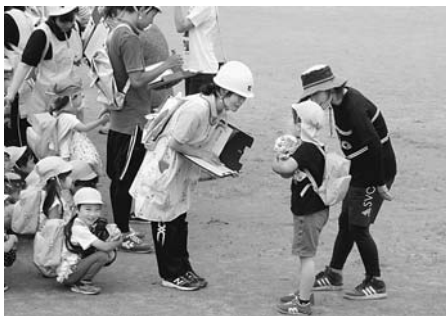
保育園での訓練の様子

自然災害だけでなく、不審者が出没した際にも、引き渡しが行われることもあり、真剣に取り組んでいました。