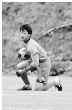
中学生の頃の雅空さん