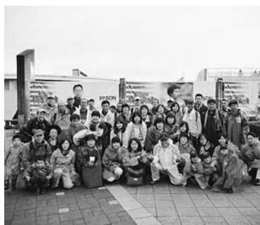
アルウィンでの集合写真

当日は大雨も予想される天候でしたが、分館役員・参加者の日頃の行いが良かったこともあり、試合が始まる頃にはそれまで降っていた雨も上がりませんでした。試合は残念ながら負けてしまいましたが、バスの中で練習した応援で精一杯の声援を送った参加者は、スタジアムの雰囲気も堪能しサッカー観戦を楽しみました。