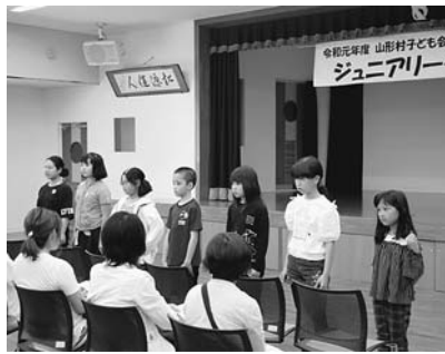
本年度のジュニアリーダー7名