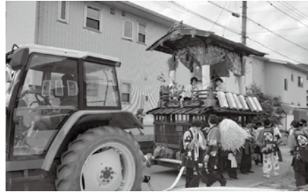
時間短縮と人の密集を避けるため、トラクターによる舞殿の曳行を行いました