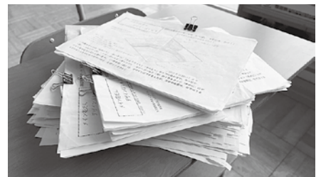
全校から集まった花壇デザイン