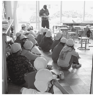
クラス点呼の様子

9月22日(木)、山形小学校にて、避難訓練が行われました。訓練前には各学年で実際の災害対応に備え、小さい子や高齢者にも手を貸すことで立派な手助けができるという『互助』と『共助』について学びました。その後、地震を想定した訓練を行いました。 訓練を通して、自分の身は自分で守る“といった『自助』について身をもって学んだ様子