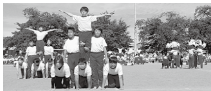
5・6年生の組体操「わたしたちのふるさと」

昨年引き続き全校児童が一堂に会し開催され、コロナ禍以前の運動会を思い出させてくれる雰囲気でした。短距離走ではスタートの構えから緊張感が伝わってきました。ここ数年踊れていなかったじゃんずら音頭を子どもたちがアレンジした踊りを見せてくれたり、今年流行ったきつねダンスを踊る仮装した1年生に癒されたりしました。5・6年生の組体操では、山形村の風景や古くから大切にされてきたものを全身を使って表現しました。 閉会式が終わり充実感のある表情の子どもたち。一人一人が全力で楽しむ運動会は素晴らしい体験だったのではないのでしょうか。