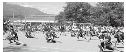
4年生の「フレッシュ!山小ソーラン」