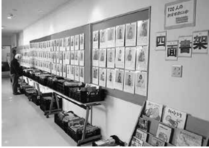
昨年のリサイクル本提供の様子

■今年の目玉は『ポプラディア百科事典』。新版入れ換えにつき、抽選で差し上げます。