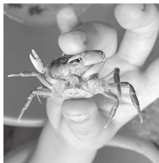
サワガニの赤ちゃんの孵化に遭遇