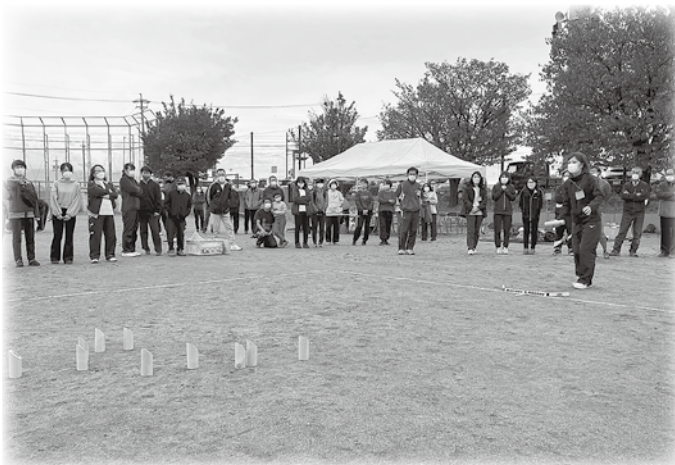
決勝戦の展開に熱い注目が集まる