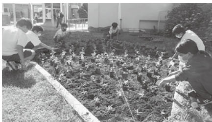
紐を張って花の苗位置を決めます

今年の児童会テーマは「笑顔いっぱい 楽しい 山小」です。そこで、花園委員会では、「お花いっぱい きれいな 山小」を花で学校を元気に! 地域を元気に!! をテーマとしていろいろな活動を考え取り組んできました。 取り組んできた活動の一つにメイン花壇のデザイン募集があります。全校から募集したことでさまざまなアイデアをもらうことができました。そのおかげで、全校に興味を持ってもらい、みんなで考えた素敵な花壇になったと思います。 毎日分担を決めてお花のお世話、種まき、土入れなどもやってきました。そうやって育てた苗を、学年ごとに花を植えてもらったり、学校支援環境行事ボランティアの方と村のトレーニングセンターに植えたりしました。これらの活動をするために、いろいろな方に協力してもらいました。大変なこともありましたが、全校のみんなや地域の方が花を見て、笑顔になったり、明るい気持ちになったりしていたことが嬉しかったです。また、地域にも花を広げることができたのでよかったです。