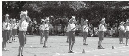
1年生のダンス「コロナッツ」