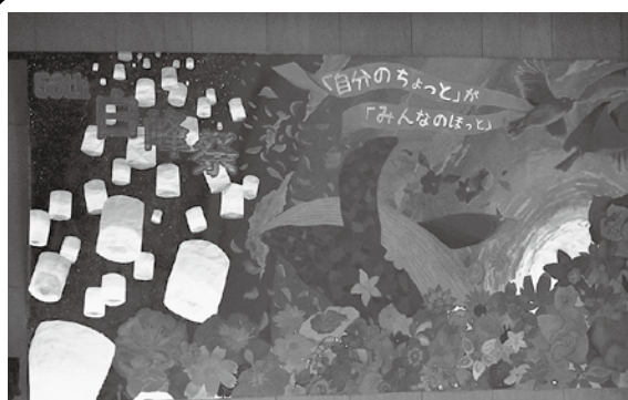
ブラックライトでライトアップされた美術部作成『ステージバック』