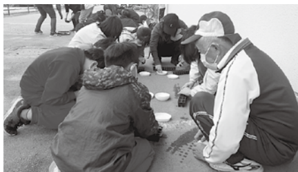
ボランティアの方と種まき