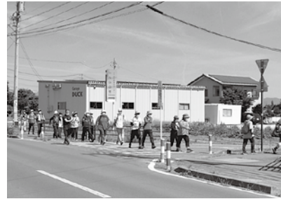
綺麗な姿勢で歩いています

行姿勢を屋内で実施。後半はこの日のために考えられた約3キロメートルのコースをアドバイスを受けながら速度に変化をつけて歩きました。