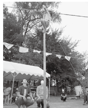
竹の先を目指してスイスイ

今年度は親子で行う競技が3年ぶりに再開となり、親子でのふれあいや保護者同士の交流が見られ、和やかな雰囲気になりました。 演目には各年齢の園児たちがこれまで主体的に取り組んできた活動を取り入れており、のびのびと身体を動かす園児たちの姿に、保護者からは「子どもたちが自分で決めたことに今日まで頑張ってきたと思うと感動しました」との声が聞かれました。