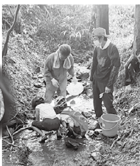
体長5cm以上のヤマアカガエル

なろう原公園の林に流れる沢で探索を実施。溪流系のトンボの幼虫が多く生息するこの沢では、小学生レンジャー隊も積極的に採取を楽しみました。山間部でしか見られないヤマアカガエルや、サワガニの赤ちゃんが卵から孵化する場面にも遭遇し、「初めて見た」と興味深く観察していました。