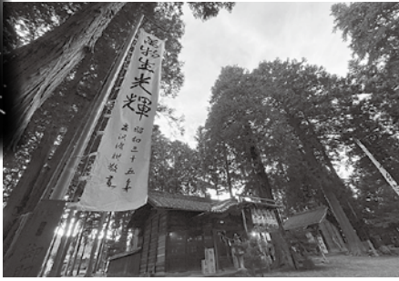
17日には大輪の花火が竹田の空に咲きました

各地区の工夫を凝らした取り組みに、懐かしさと地域に活気を感じた方も多かったのではないのでしょうか。来年こそは地域住民が集い、本来の例大祭が行えることを待ち望むばかりです。