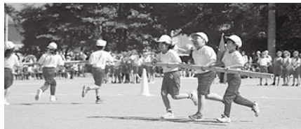
3年生の競技(Sun 3 ハリケーン)