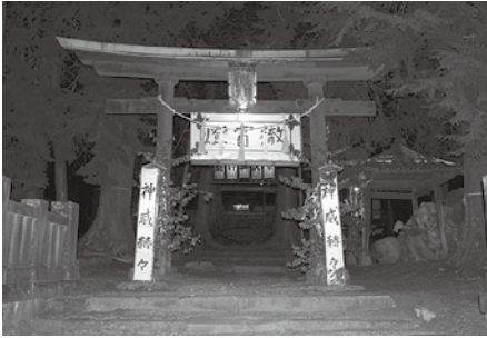
神事のみ厳かに執り行われました