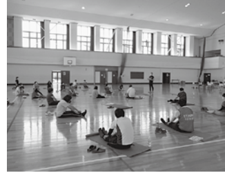
ストレッチだけで汗ばむ姿も

行姿勢を屋内で実施。後半はこの日のために考えられた約3キロメートルのコースをアドバイスを受けながら速度に変化をつけて歩きました。