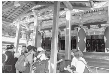
久能山東照宮見学