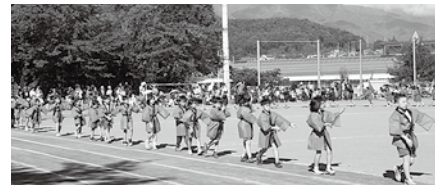
2年生の「山にこじゃんずら」