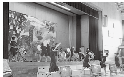
学年発表3学年白峰タイム『朝日太鼓講座』