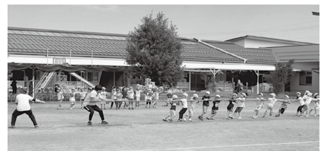
先生たちに負けないぞ~