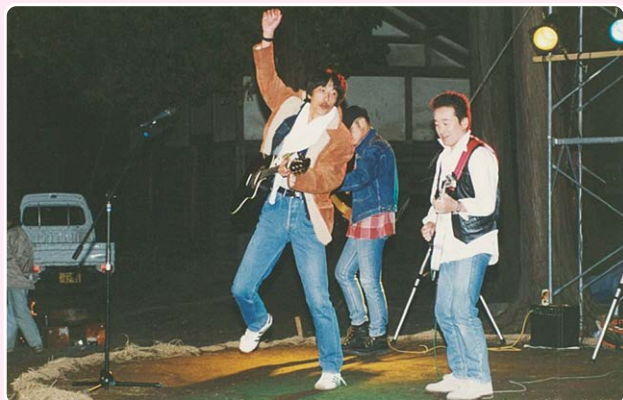
開村120周年記念ドラマ「修治」作成