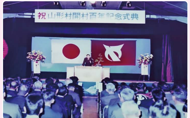
開村100周年記念式典