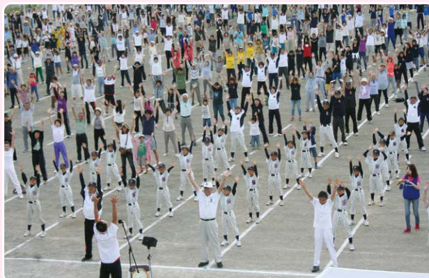
開村140周年記念夏季巡回ラジオ体操