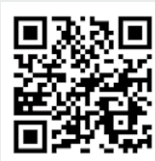
幸地隊員による 山形村移住ブログ

行なっているので興味ある方はぜひ、ご参加ください。 村内には約100件以上の空き家が存在すると言われて います。空き家は放置すると獣の巣になったり、倒壊の危険 が出てきたり、単純に固定資産税が掛 かったりとネガティブなことが多いです。 また、来年令和6年度からは相続登記の 義務化の法律も施行され、登記を見直 す機会が増えてきます。空き家を所有 して困っていることがあれば、いつ でもご相談ください! 役場の企画振興 課に私はいます! 以後お見知りおきを!