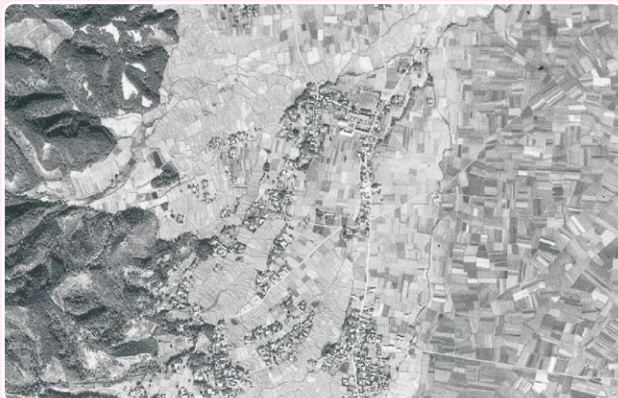
1948(昭和23)年の山形村役場近辺の航空写真