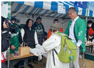
特産の長いも販売