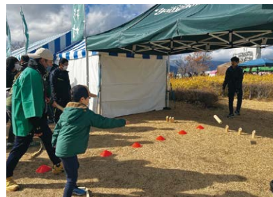
モルック体験コーナー