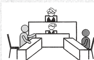
裁判官が主張と証拠に基づいて判決