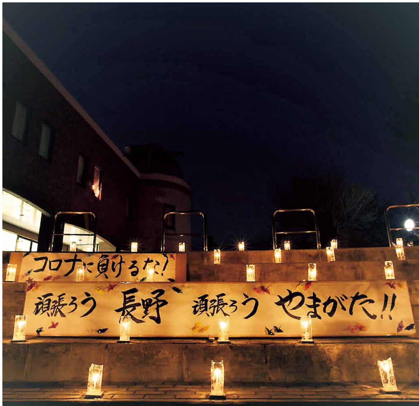
アイスキャンドル