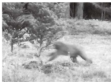
人を見ただけで逃げるサル。人慣れする前に追い払いましょう。

人間にとって無価値な廃果や生ごみなども、サルにとってはごちそうです。田んぼや畑に廃棄するとサルを呼び寄せることになるのでやめましょう。