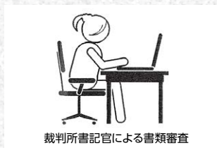
裁判所書記官による書類審査