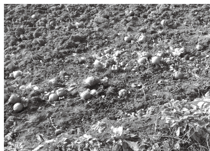
農地に放置されたタマネギ。サルをはじめとする野生鳥獣を呼び寄せます。