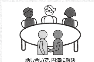
話し合いで、円満に解決