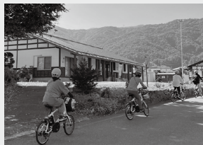
サイクリングツアー

今年は協力隊として2年目に入ります。観光振興担当として、もっと地域のみなさんと関わり、魅力発見に繋がりたいと思っていますので、今年もよろしくお願いたします！