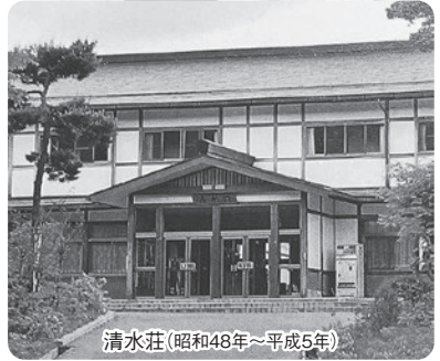
清水荘(昭和48年～平成5年)