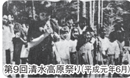
第9回清水高原祭り(平成元年6月)