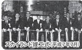
スカイランド竣工式(平成7年7月)