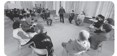
2グループでのワークショップ

ニティの再構築と人権、新旧住民の共生に向けて」のテーマでお話を聞いたのち、2グループに別れワークショップを行いました。