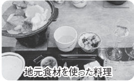
地元食材を使った料理