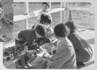
1年生 あきとあそぼう

5年生は1年間学んできたお米作りの発表をしました。田植えから稲刈りまで昔と今の違いを学習した子どもたちは、「昔の人が苦労してお米を作っていたのがわかった」などの感想を発表しました。この日は育てたお米でおにぎりを作り、お米作りでお世話になった方々に感謝を込めてふるまいました。一緒に食べた子どもたちからは「1年間苦労して作ったお米は甘くて最高でした!」という感想が聞かれました。