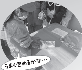
うまく包めるかな...

11月12日(水)、山形保育園で毎年恒例の焼きいも会が行われました。少し肌寒いですが、秋晴れの天気にも恵まれ、各クラス分担当作業でさつまいもの準備は万端、みんなで投げ入れました。おやつ時間は外に集まり、みんなで食べて今年も大成功でした。