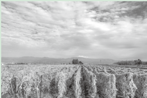
「秋空に映える長芋の紅葉」