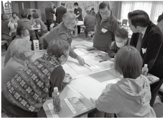
「避難所体験ゲームひなたの様子」

ここ何年かの総合防災訓練は、安否確認訓練に重点を置いて実施してきました。自身の安全、家族の安全、隣近所の安否といった個人レベルの情報収集をお願いしてきました。安否確認訓練を重ねていく中で、避難所へ避難した後はどうなるのか、本当に避難所で生活していけるのか、様々な課題が見えてきました。今年度は、安否確認、避難のその先、避難所の開設に重点を置き、訓練を実施します。