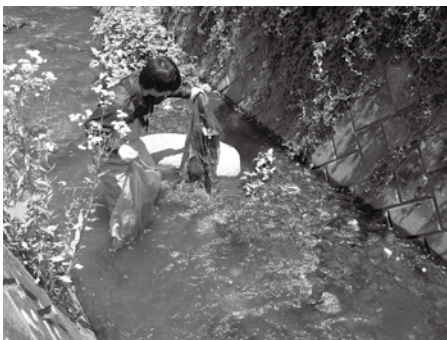
レジ袋やペットボトルが目立つ河川